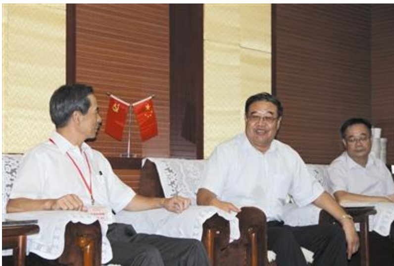
宁夏政协副主席田成江（右一）会见香港福建希望工程基金会主席杨自然。