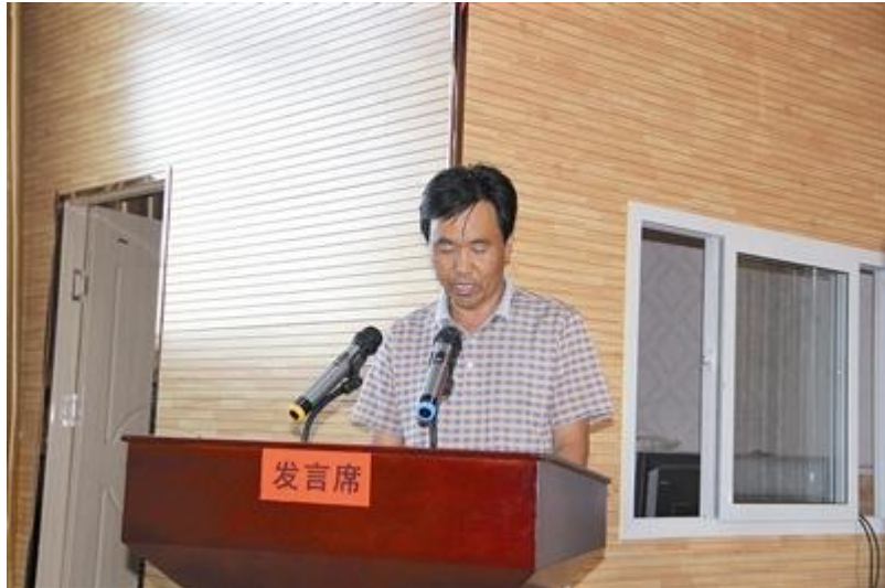
“最美乡村教师”代表发言。