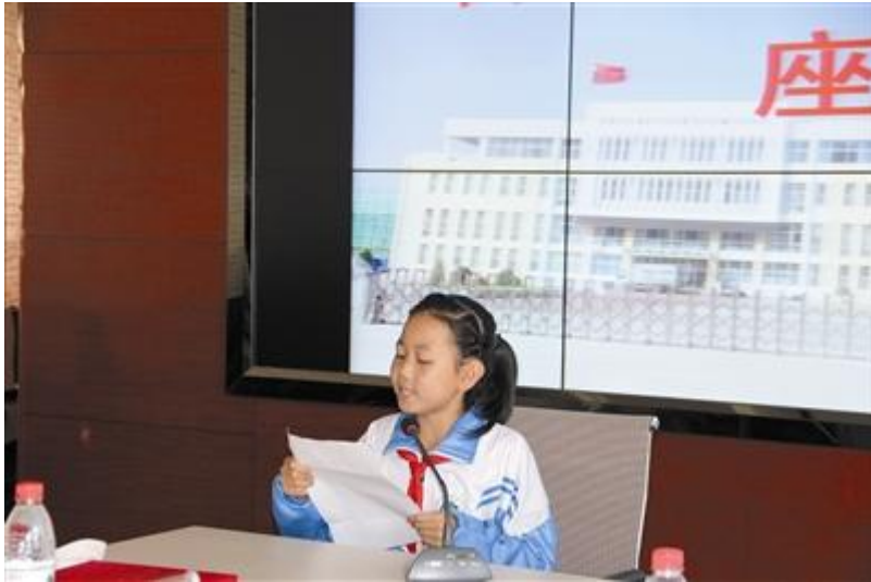
固原市实验小学学生代表发言。