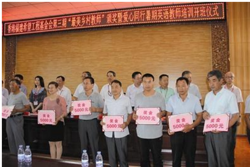
“最美乡村教师”颁奖现场。