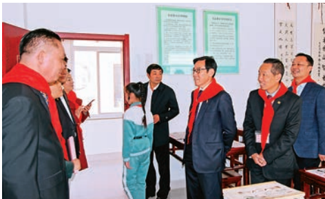
▲訪問團成員參觀淄博市張店區灤水鎮第一小學「正心希望小學」教學設備和學校運作情況