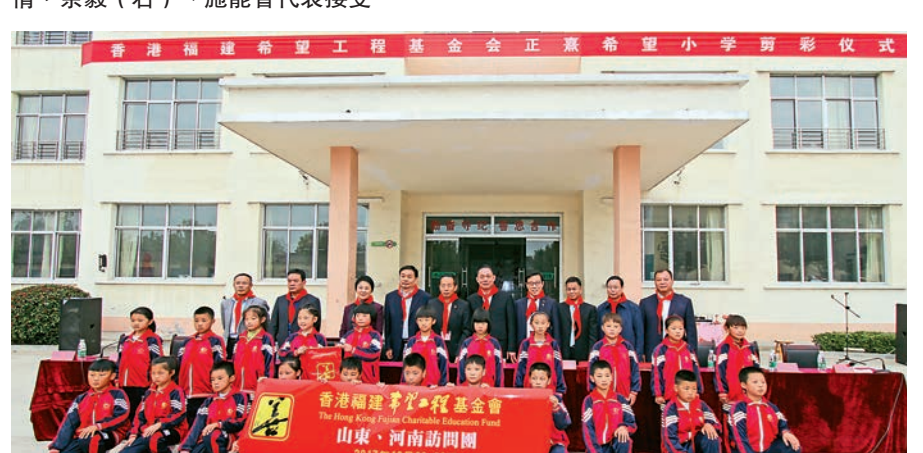
▲訪問團成員為新泰市果都鎮「正憲希望小學」師生在新建的教學樓前合影