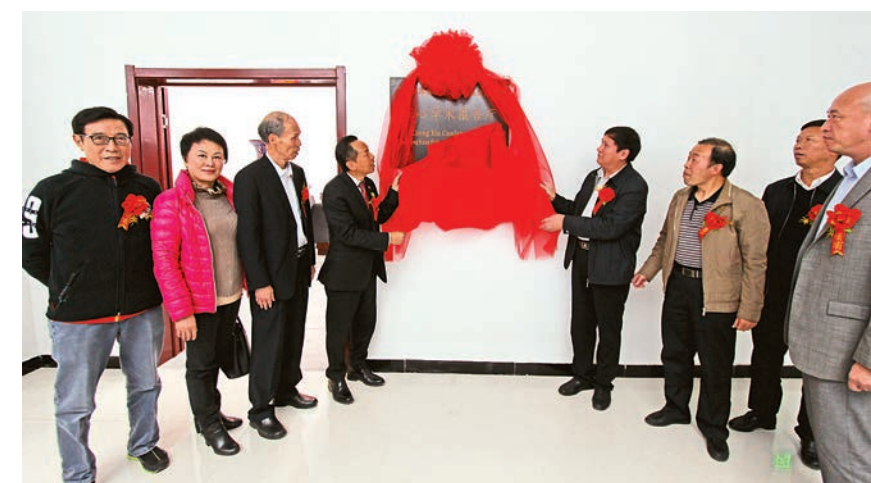
▲訪問團成員為魯山縣第一高中「香港福建希望工程基金會正心學術報告廳」落成揭牌