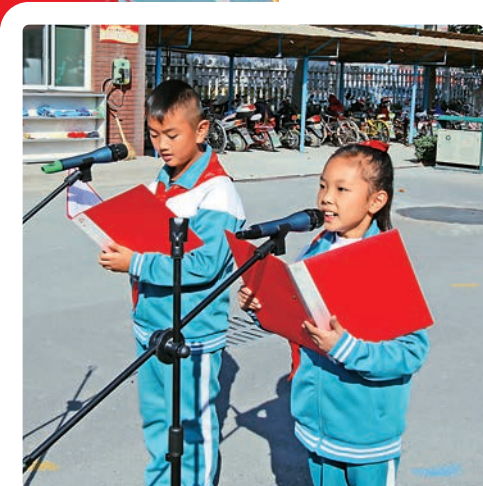
▲淄博市張店區傅家鎮傅家實驗小學「正心希望小學」學生登讀少先隊員獻詞