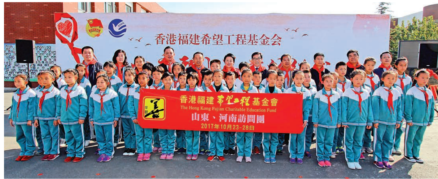
▲訪問團成員與淄博市張店區傅家鎮傅家實驗小學「正心希望小學」學生在落成典禮上合影