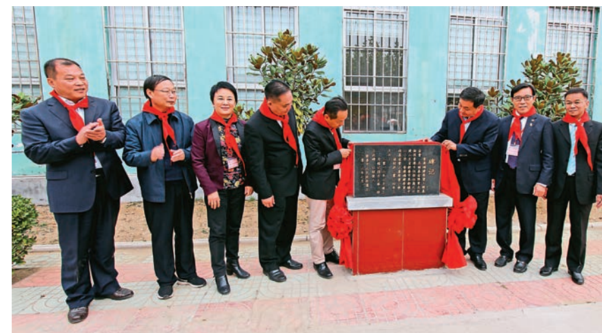
▲訪問團成員為新泰市果都鎮「正憲希望小學」揭牌