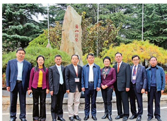
▲新泰市市長趙書剛（中）歡迎香港福建希望工程基金會訪問團一行，感謝基金會和陳秉志伉儷對新泰市教育事業的支持