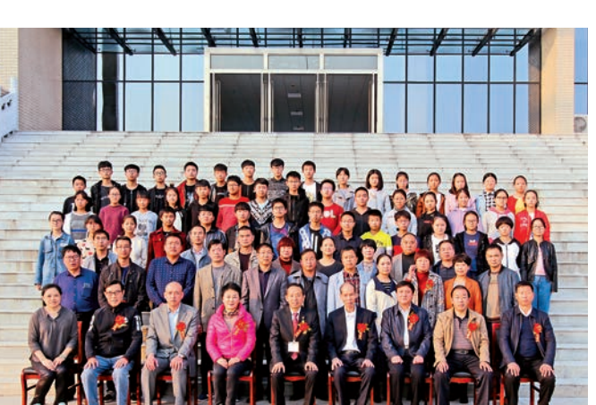
▲訪問團成員與魯山縣第一高中師生合影