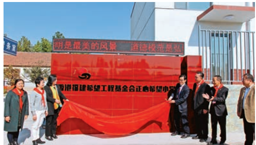
▲訪問團成員與淄博市張店區領導為淄博市張店區灤水鎮第三小學「正心希望小學」新校牌揭幕