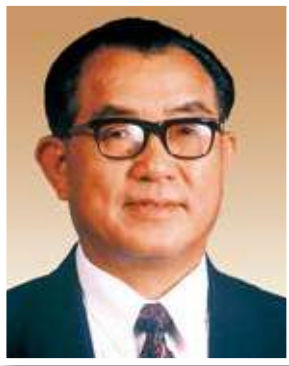
林廣兆 GBS, SBS